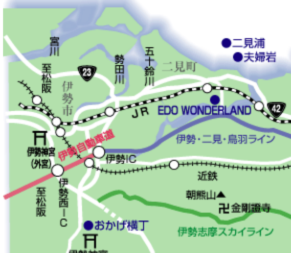
伊勢志摩周辺地図

(会場：鳥羽シーサイドホテル 住所 三重県鳥羽市安楽島町 1084 番地 Tel.0599(25)5151(代))